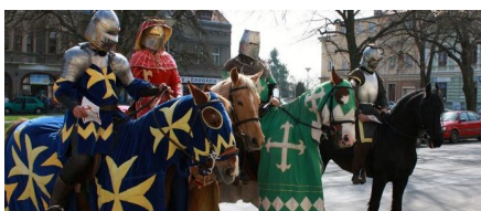
Kulturní a sportovní události

Přihlášením k odběru hlášení dává registrovaný občan souhlas se zpracováním poskytnutých osobních údajů za účelem zaslání aktuálních informací z města. Více informací o rozsahu a účelu zpracování a odvolání souhlasu najdete na adrese www.mestekralove.hlasenirozhlasu.cz nebo osobně na městském úřadě.